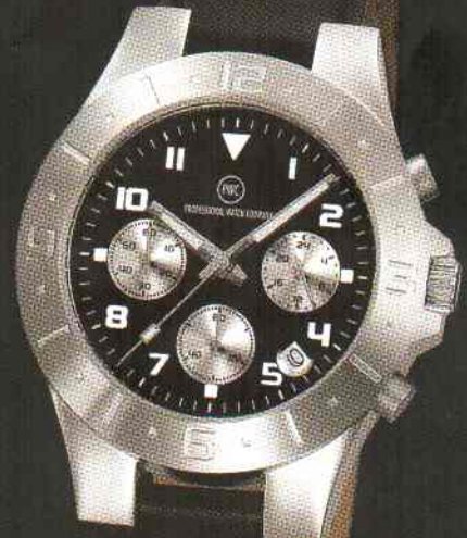
Callisto Chrono black Edelstahl Chronograph 5 bar wasserdicht nach DIN 8310 5 Jahre Garantie