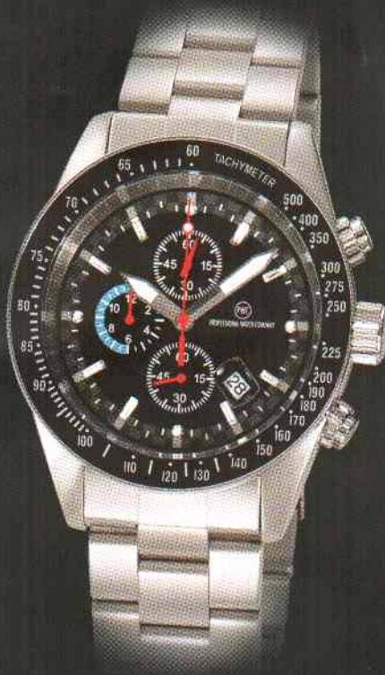
Indy Race Metal Edelstahl Chronograph 5 bar wasserdicht nach DIN 8310 5 Jahre Garantie