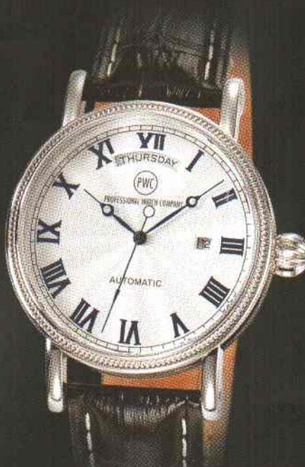
Pandora Automatic chrome Edelstahl Gehäuse mit Glasboden Mechanisches Automatik-Uhrwerk 5 bar wasserdicht nach DIN 8310 5 Jahre Garantie